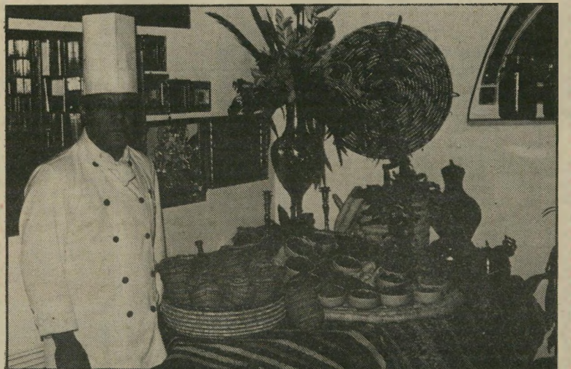
"מרחבה" — ביקור במארוקו במחיר מפולפל

ולסיום רק הערה אחת, שנראית לי חשובה: כשאני יוצאת בערב למיסעדה טובה, אני מתכוונת לאכול טוב וגם לנוח ולבלות. את הילדים שלי אני אף פעם לא לוקחת, כי עם הילדים אי-אפשר לבלות. אז לוקחים בייבי-סיטר, משלמים לה רי הרבה כסף ויוצאים מהבית כדי לא לשמוע את הציצופים שלהם ואת המילה "אמא, אני רוצה!" ואם את הילדים שלי אני לא רוצה לידי בערב במיסעדה, לא כל שכן אני לא רוצה ילדים של אחרים. אולי בעלי המיסעדות המפוארות, שארם משאיר בהן שליש משכורת, יחוקקו איזה חוק שלילדים קטנים ונודניקים, אסור להיכנס למיסעדות אחרי 8 ערב? מה אתם אומרים?