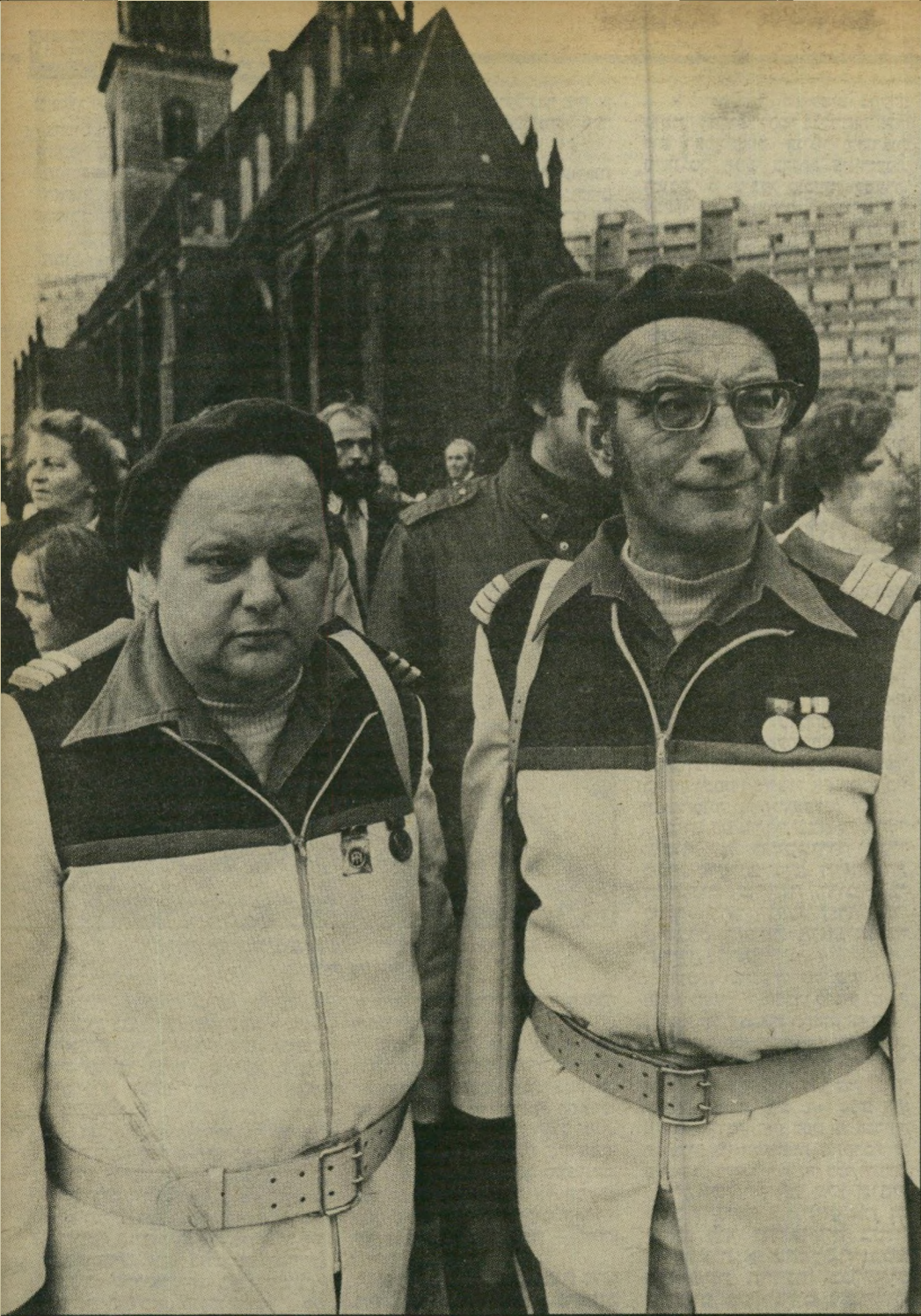
צעירים בגרמניה המזרחית: תזמורת. הנער הגרמני החופשי כמו בדיחה יהודית ישנה

המילחמה בויהום הסביבה, המאבק לצדק סוציאלי ודברים טובים אחרים. זוהי תנועה אנתנטית גדולה, שצמחה מלמטה. אחד מביטוייה הוא מיפלגת הירוקים, שהפכה למיפלגה השלישית בגודלה במדינה. תנועת השלום הגרמנית קיבלה צביון אנטי-אמריקאי חריף, ועל כן הוחשדה לא פעם כאילו היא פועלת בשליחות הסובייטים. אך מחוץ לסוכנים הקומוניסטיים, שחררו אליה מרדר הטבע, זוהי תנועה גרמנית