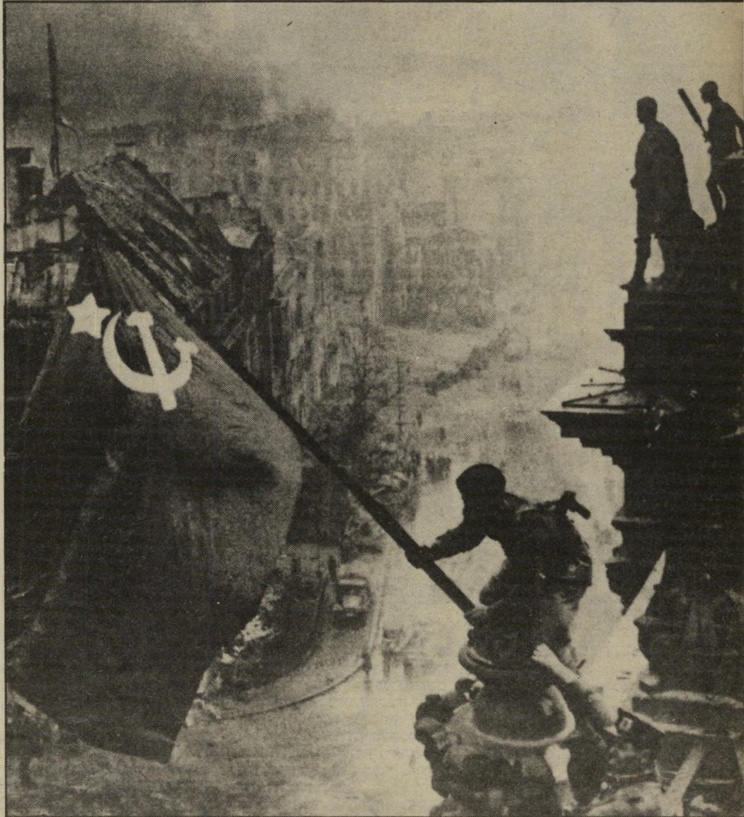
1945: חיילים סובייטיים מניפים את הדגל האדום מעל לבניין הרייכסטאג בברלין למנוע איחוד בכל מחיר

בהוגים של הוגי-ידיעות החלו מדברים לא רק על שתי מדינות, אלא גם על שני לאומים גרמניים חדשים, בעלי תרבויות שונות המתרחקים זה מזה במהירות.