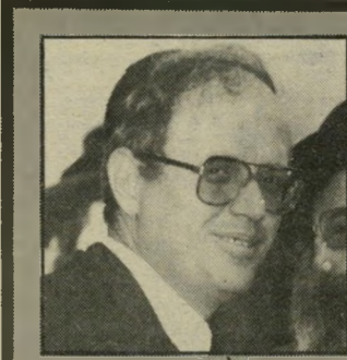
פרנקליט זינרוב גירסת היהלומן

אך הקש ששבר את גביהגמל היה צו שהוציאה המישטרה, ב"2 באוגוסט, לתפיסת יהלומנים של יהלומנים