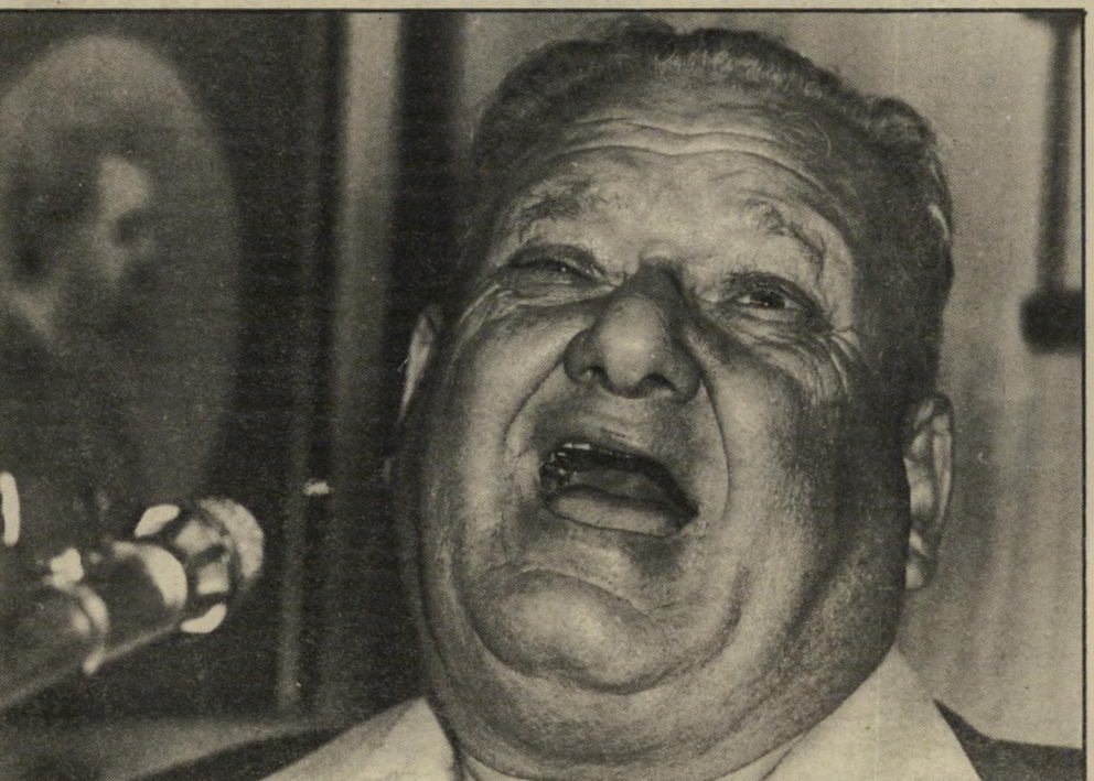
מזכיר בניתן צעקה אחרונה

בורג וחבריו עמלו קשה כדי להשיג זאת. תודות להם נשפכו