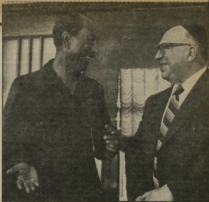
השר הממונה על דיוני האוטונומיה: עם סאדאת המשא ומתן מת