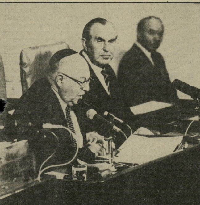
בורג כיו"ר הכנסת (עם הנשיא) וגם שופט עליון ורב ראשי