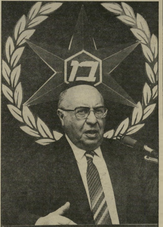
השר הממונה על המישטרה מכות ועינויים