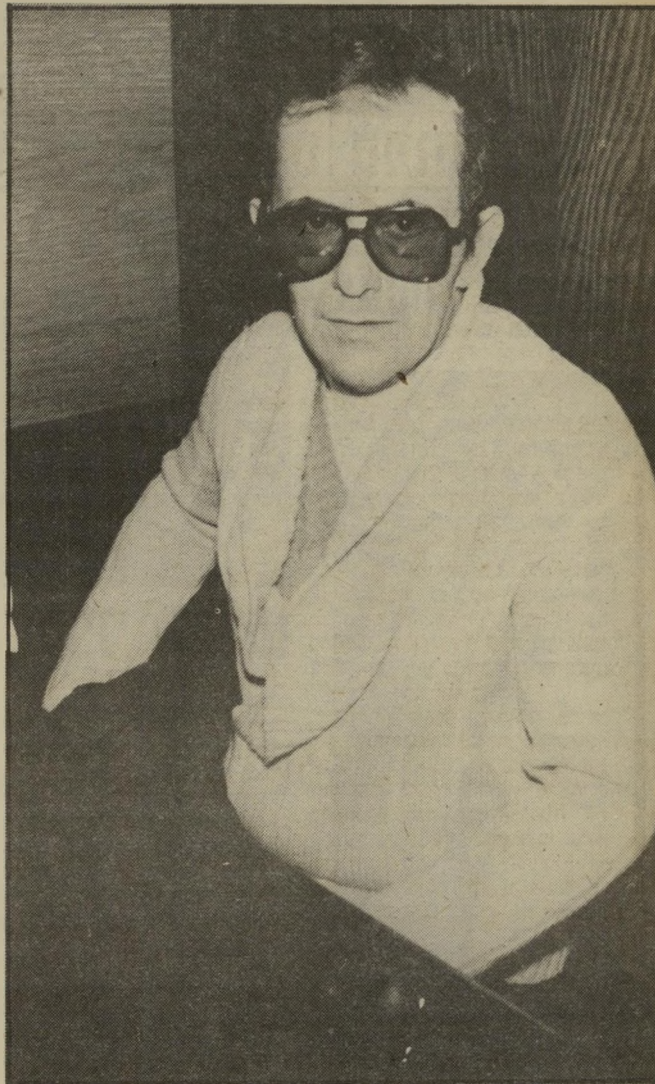
צלם-פורנו גרנות פיתיון לטיפשות

סוטי-מיין הרגילים מופיעים ככרדי ניקה העיתונאית כמעט מדי יום. גברים המוצאים את סיפוקם המיני כאינסון של נשים ונערות, במעשים מגונים כילדות וילדים, בחשיפה מינית ברחוב ובסוגים אחרים של סטיה מינית, אנשים אלה יכולים להיות פתטיים או מסוכנים וקטלניים. שלמה