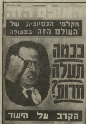
הקלמי הניסיונית של העולם הזה בפעולה

ולורנצו. שניהם מכרו את נישמותיהם לשטן, בער שיקלינייר. הם חדלו ללחום בשביל הדת, ובמקום זה היו עוברים בשביל כוכטות של שיקלינייר. ובתחילת שילטון בגין נתן