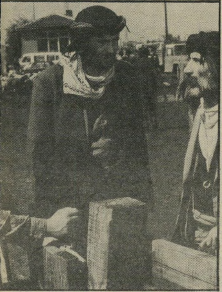
העדר בא העירה בעוצמה משכנעת