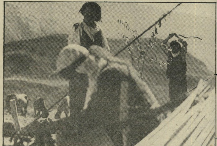
מלאחים פרימיטיביים בסרטו של גיני, «העדר» ניגודים ומילחמות

★ ★ ★ אינדיאנה ג'ונס (תל־אביב, ארצות־הברית): סרט זה, המוצג בשלוש הערים הגדולות, הוא קולנוע מרתק ומשעשע גם יחד. אין צורך לקחת ברצינות רכה את האמת