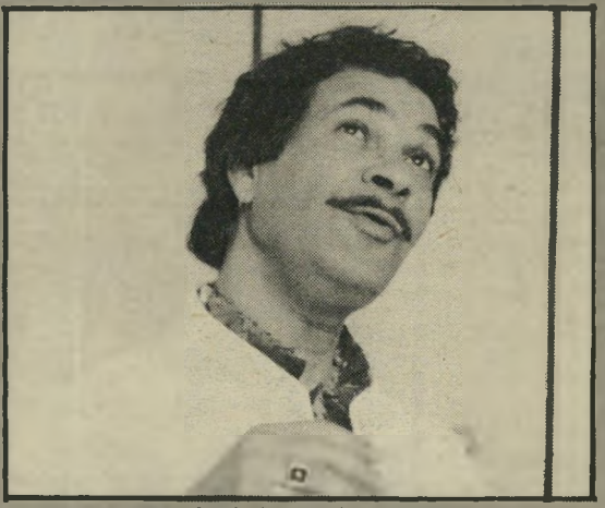
זאב רווח: לא מזלזל ולא רשע

ספר צמרת (אלנבי תל־אביב, ישראל) - זאב רווח רוכב שוב באחת הקומדיות האומייניות שלו. יש לו תפקיד כמול שהוא תפר לעצמו. הוא יכול להדשות לעצמו להמגין לראווה את כל מערכת העוויות המגוונות שהוא מיתח לעצמו במשך השנים, ואם לשפוט לפי תקדימים, זה בדיוק מה שמעריציו מצפים ממנו. ובשביל זה הם רוכשים את הכרטיסים לסרטי. העלילה? הפעם מדובר בשני אחים תאומים, אחד פועל־ניקין בבית־התעשייה, ותוך כדי עבודתו, הוא נתקל בכספת פתוחה. מלאה עד אפס מקום בדולארים מן השוק השחור. בהיותו מטופל בילדים לרוב ובהכנסות מעטות בלבד, הוא אינו עומד בפני הפיתוי, אבל כראוי לאיש שהוא בעצם הגון, למרות חסרון־הכיס, הוא נכנס מייד למאניקה. מה עושים? פונים לאח התאום, זה שלא נראה באופק כבר שנים רבות. האח הפך בינתיים לספר צמרת ולדמות פעילה מאוד בקהילה העליונה, ורק משום שדם אינו הופך למים, הוא מסכים להושיט יד לשלומיאל ולסדר את העניינים.