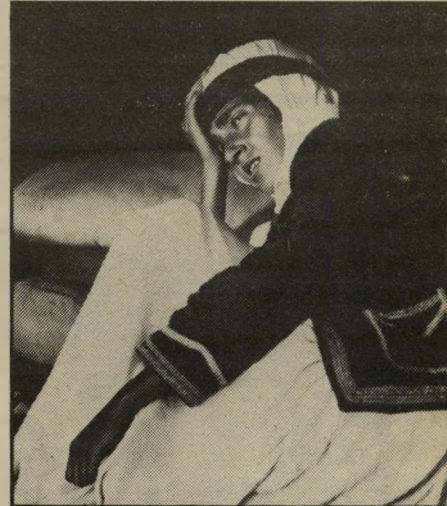
הכלה השנואה ב"העדר" חינוך ארכאי

העדר הוא הסרט הראשון של גיני, אשר נעשה בהתכתבות. הכוונה לכך שאם גיני כיים סרטים קודם לכן, בכוחות עצמו, הרי מן הרגע שהושלך לכלא, כעוון רצה, שהוא טוען כי לא היה אלא הגנה עצמית, נמנע ממנו לעשות זאת. אומנם, בין כותלי הכלא כתב שני תסריטים, אבל לדעתו עיוותו האנשים שהשתמשו בהם את כוונותיו, ללא הכר. עם העדר נהג אחרת, נתן לבימאי זקי אוקטן הוראות מדוייקות ומפורטות עד הפרט האחרון, ומשום כך הוא מתייחס לסרט