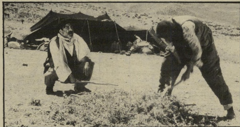
האב הפטריארך הרודף את כלתו תורכיה מגררת

בהם היה ברדלס הזהב בפסטיבל הסרטים בלוקארנו. עלילת הסרט מתרכזת סביב מישפחת רועים כורדית (מוצאו של גיני ממישפחה רומה לואת, אבל מן הפרולטריון העירוני) שנעה ונדה עם אבוליה באזור השומם והמרוחק של אנאטוליה,