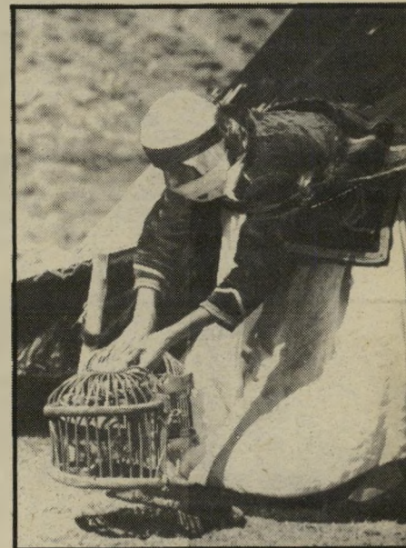
הכלה מתכוננת לצאת לדרך דעות קדומות

כאילו כיים אותו בעצמו, כאשר אוקטן בעצם אינו הרבה יותר משלטר חוק. סרטים בינלאומיים , על מעלליו של גיני, על עימותיו הפוליטיים עם המימסד התורכי, על ההערכה שבה זכה כמולדתו כשחקן, שנים רבות לפני שהחל לעשות בעצמו סרטים, אין טעם לשוּב דבר כאן, הרי הכל רווח בפירוט, כאשר הציגו בישראל את יול. מצד שני, כראי מאוד להתעכב רווקא על התכונות המאפיינות את הסרט הזה, שהיה הראשון אשר קבע את שמו של גיני ברשימת היוצרים החשובים באירופה, וזיכה אותו בסדרה של פרסים בינלאומיים, שהראשון