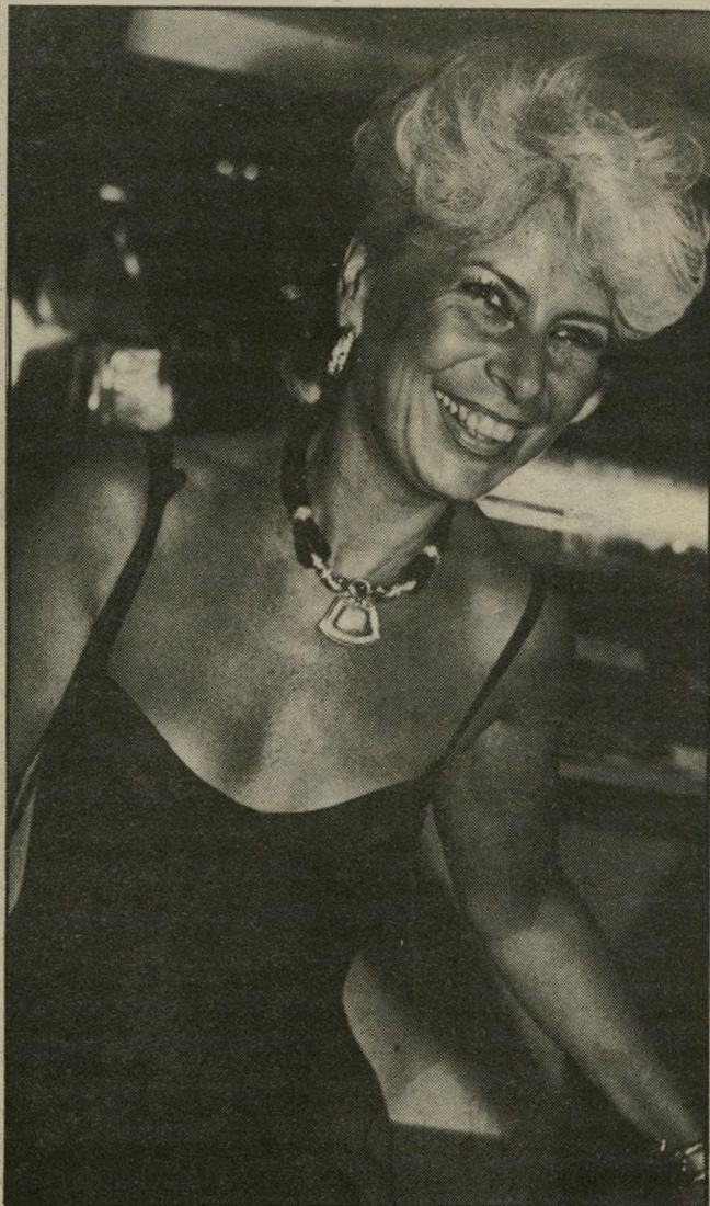
מוניק לאופר מעצבת-אופנה מצרפת ובעלת בית-אופנה שנקרא אלכסיס דרסאק, שהוא בית-אופנה המשווק בגדים המיועדים לגברים בלבד. מוניק, הנמצאת בחופשה בארץ, לא ביקרה בהצגה, היא היתה בצד הפורח של "הבימה" - המיסעדה.