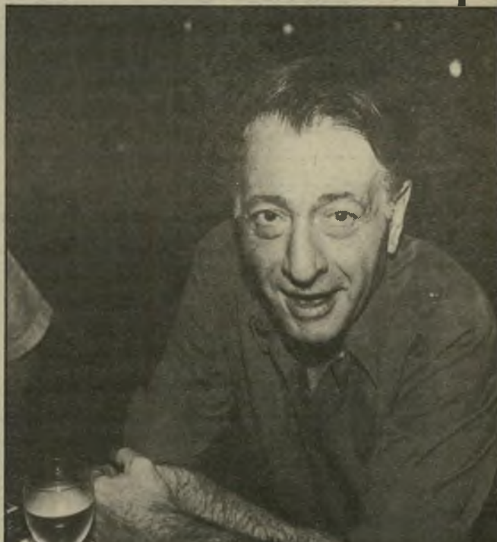
ניסים אלוני המחזאי ביקר בשני המקומות, ראה את המגדלים הפורחים, שהופכים ללוהטים, ואחר-כך גם ביקר במסעדה החדשה, הפתוחה לקהל הרחב משעות הבוקר עד השעות הקטנות של הלילה (אבל ביום שישי בערב המיסעדה סגורה).