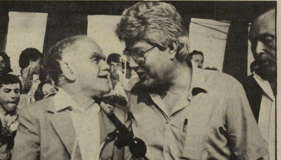
לוי ושמיר האם יוכל שמיר לנטרל את לוי ושרון?

שבחים ומילות-ארגעה. לוי מתפייס — עד ההתפרצות הבאה. אבל בינתיים הוא צובר ואוצר כמויות עצומות של עבר וזעם. גם הפעם החשוד העיקרי הוא רוני מילוא. המיני-פרשה החדשה פרצה עקב פירסום באחד הצהרונים, שהאשים את לוי בנסיון לטרפד ממשלת "אחדות לאומית" עם המערך.