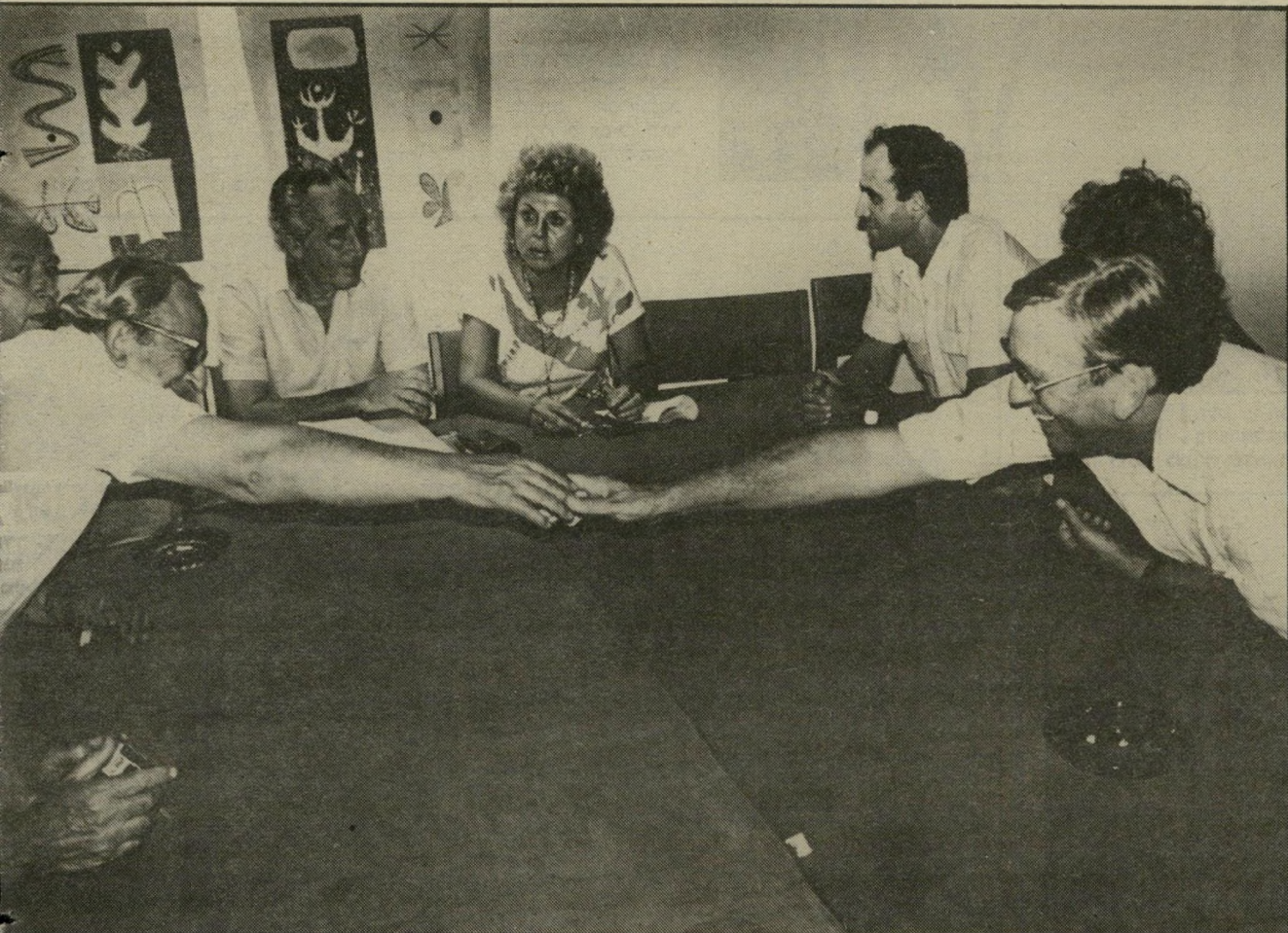
היה רחב מדי, לכן היו צריכים השניים ממש להשכב עליו כדי שידו של האחד תגע בידו של השני. בפגישה שהיתה למיפגת רץ עם המערך נכחו גם רן כהן, שולמית אלוני, שימעון פרס ויצחק רבין (מאחורי נבון).

יתנו כלום ולא יקבלו כלום. אפילו העיתונאים הרבים שצבאו ומילאו את המיסדרון הצר של הקומה השביעית, לא היו במתח. שום דבר לא עניין אותם, פרט לעובדה המעיקה שלא היה מיוג-אוויר במיסדרון והיה חם מדי. גם בתוך החרר פנימה, כחררה-השיבות, לא היתה אווירה מתוחה. השלישיה, הרביעיה, או החמישיה הפותחת של מיפגת העבודה ישבו בתוך החרר וקיבלו אנשים ומישלחות לפי התור, כמו אצל