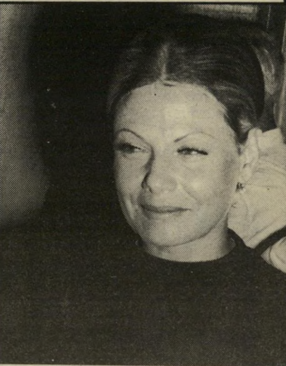
אורה בהרב מזכירה

כמה תושבים מסתובבים בתל-אביב? קרוב לארבע-מאות אלף חיים בה, ועוד ארבע-מאות אלף מגיעים אליה בכל יום ויוצאים ממנה בכל ערב, מינימום: ובאירועים מיוחדים? הוסיפו עוד קצת, אולי מאתיים אלף נוספים, וביחד לכמה הגעתם? לכמעט מיליון? או לכמה מתכוונים כשאומרים "כל תל-אביב"?