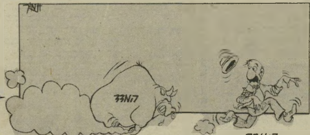
קריקטורה של הקורא תמיר שפר תקציב של שנה בשטר אחד

עם תום המלחמה הוכרזה החברה כאירגון פושע, פורקה למרכיביה וחשיבות הנבק שלה בשווייץ הוקפאו. המיכנים האיריים שלה במרכז פרנקפורט הוחרמו, ועד היום הם משמשים את מטה הצבא האמריקאי בגרמניה. איש לא זכר שחברה מיסחרית בשם זה עדיין קיימת.