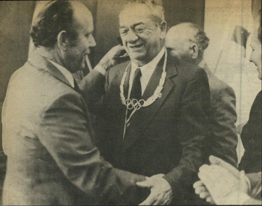
מקבל מדליית כסף מהוועד האולימפי הבינלאומי היהודי היחיד בעולם