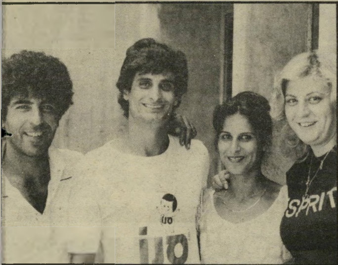
ארגוב עם מזכירתו, אחותו וגיסו. השוטרים התערבו ביניהם שלא אחזיק מעמד אפילו יומיים!