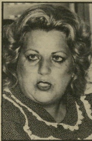
אסטורלוגית תמיר אפילו לא שותה

אינני קוראת בקפה, אינני מאמינה בקפה ואפילו אינני שותה קפה, אלא רק תה עם נענע.