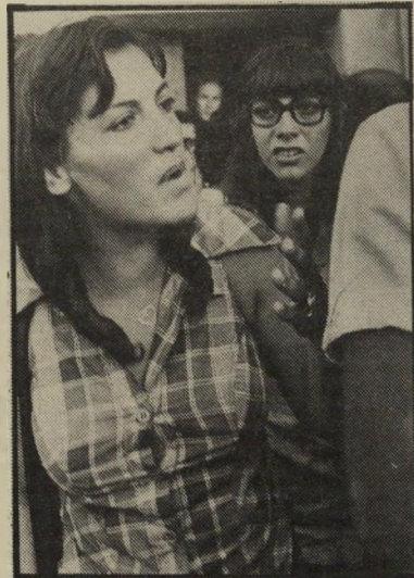
כתבת חדשה רבדל שיכולים מוזרים