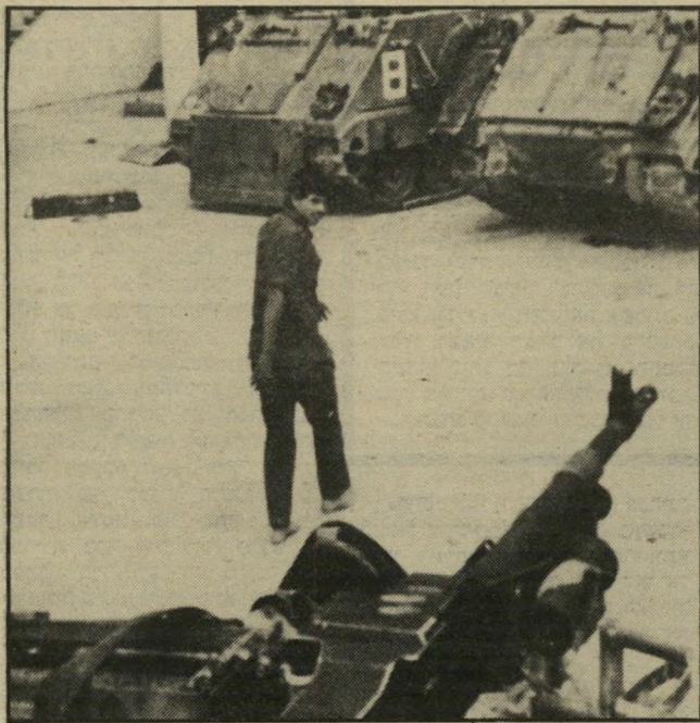
יואב שסיגל בלבנון. הונו אותו וניצלו את הנאמנות שלו!

הרגע. הוא אמר שבאותו זמן הם היו באמצע הקרבות, היתה אש תופת מכל כיוון ולא היה להם זמן לחשוב, אבל יותר מאוחר, בלילה, כשעצרו להתאר-גנות, הם התחילו לעכל פיתאום את מה שהם שמעו ברדיו וחשבו היכן הם נמצאים באותו הרגע וזה היה נורא. חלק מן החיילים ראו את זה כערפל קרב. אבל אני זוכרת מה זה ערפל קרב. אני זוכרת כשבששת-הימים היה ערפל קרב, או כמשך שלושה ימים לא שמענו כלום, לא ידעו כלום. זה ערפל קרב, אבל לא שקר. פה ממש שיקרו אותנו.