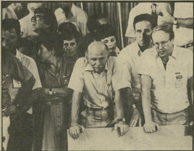
אנשי המערך ברגע האכזבה חוצפה כלפי הציבור

אך יש כמובן קשר בין השניים: טיבו של האיש קובע את טיבה של האסטרטגיה. וגם את טיב עוזרו, ראשיההמטה וראשי ההסברה שלו. יעקוב חזן הקשיש שם את אצבעו על הנקודה הקובעת: המערך לא התמודד בבחירות. הוא ברח מפני ההתמודדות ומפני החובה להילחם על ריעות ותוכניות. הוא טישטש כל הברל בינו ובין הליכוד. הוא לא הציג שום אלטרנטיבה אמיתית — לא לגבי לבנון, לא לגבי השטחים הכבושים, לא לגבי ניהול המשק, הוא סבר כי ירכוש את "בוחריו המרכז" שבניו ובין הליכוד על-ידי חיקוי הליכוד והצגת עצמו כ"ליכוד ב'". קרה ההיפך. הוסרה-המנהיגות הולירה הוסר-אמון. בוחריו הליכוד לא עברו למערך, אלא הלכו ימינה. ואילו בוחריו המערך נטשו אותו בהמוניהם לטובת שינוי ור"ץ (ברחוב היהודי) והרשימה המתקדמת לשלום (בציבור הערבי).