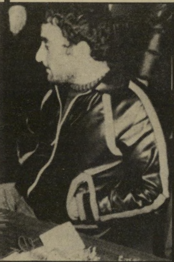
כהן בית־המישפט קבע כי עדי־המדינה כהן, למרות עברו ואופיו, הוא עד מהימן.

על עבודתם בתיק, אך נראה כי לפחות סניגור אחד ולקוחו היו מופתעים מהתוצאה.