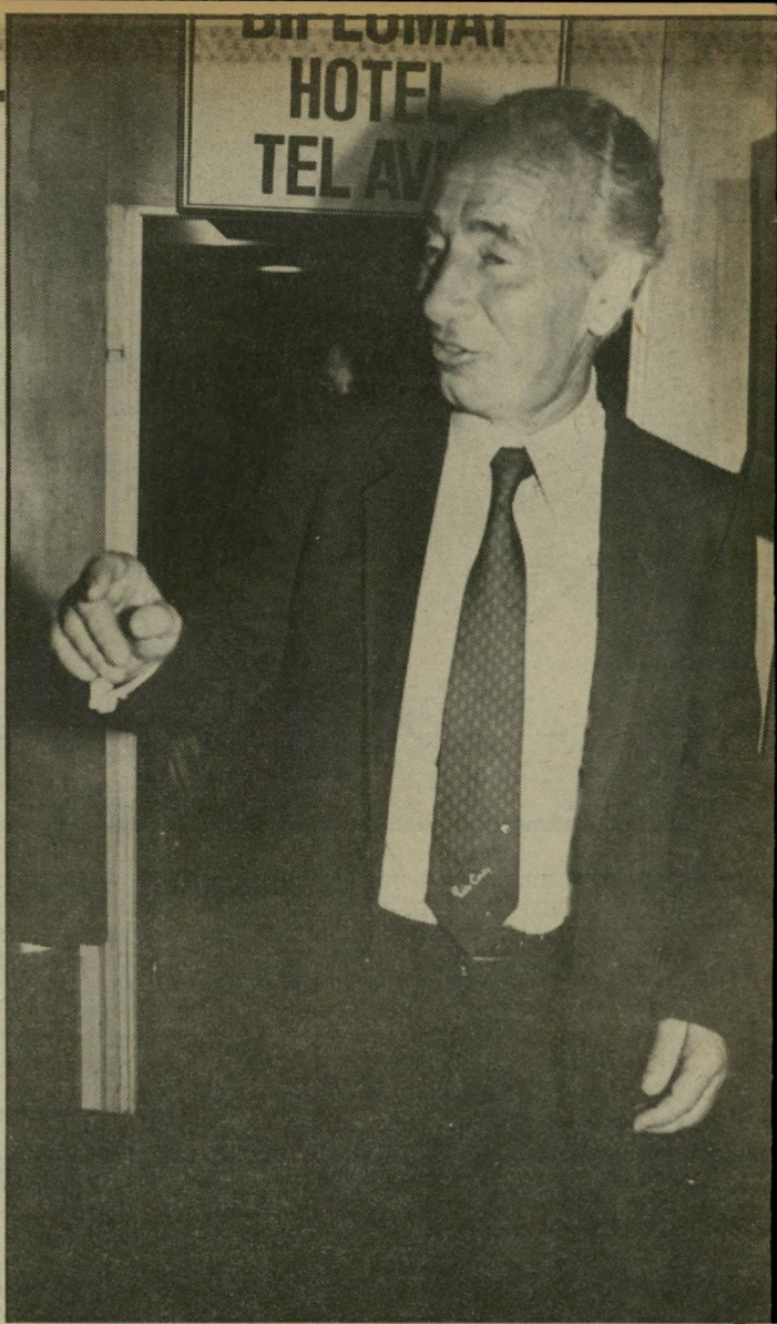
כמו ראש-משלה שימרון פרס בא למסיבה, שאיר- כמו ראש-משלה. הוא חייך ולחץ ידיים לכל, כאילו הניצחון כבר בכיסו.

קבלת הפנים. ירוחם משל (זוכרים שהיה פעם, לפני זמן קצר בלבד, מזכ"ל ההסתדרות?), בא בין הראשונים, תפס מקום טוב באמצע, מול פתח הכניסה וחיכה לראות מי יבוא. אחריו בא יצחק נבון, נוולבו שכורה של מפלגת העבודה, "שריחוץ הגיע!" לחש מישור, ספק בצחוק ספק ברצינות. והוא אכן התנהג כשריחוץ לכל דבר. שופע חיובים לוחץ ידי כולם, כשורקורי הטלוויזיה והבוקי המצלמות רודפים אחריו לכל מקום. הוא הגיע בגפו, אופירה, יפה וזוהרת כרגיל, בשימלה לבנה ארוכה, באה אחריו. הרבה זמן לדבר עם בעלה באותו הערב, לא היה לה. הוא היה עסוק מדי ביחסי ציבור. היא לקחה בשקט צלחת אוכל והתיישבה על