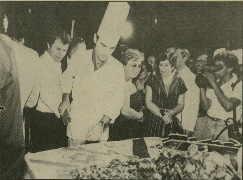
והיתה מורכבת מדינולי ישראל ומצריים. רק בסוף הערב, כשהאורחים סיימו לאכול ולשתות, הגיע הרגע לחתוך את העוגה המפוראת. וגם אותה חיסלו.