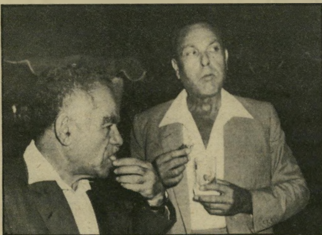
יצחק מודעי עם יצחק שמיר, לאן הוא נעלם?