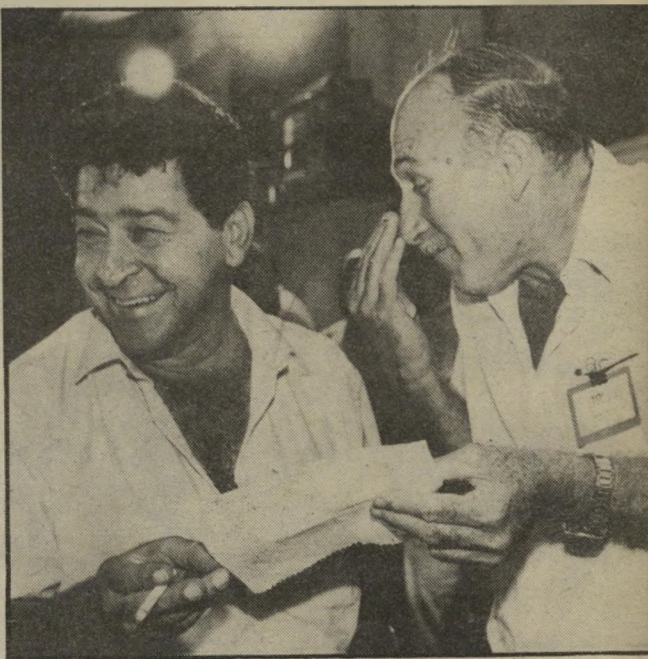
האלוף ותת-האלוף: מוטי הוד וכואד מרצינים פנים, לבסוף