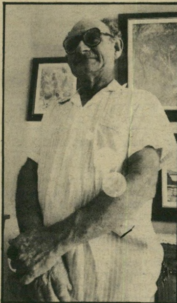
אב הרצוג אחריה לדהב

למישטרה המצרית. הם לא התרגשו במיוחד, לבריה. והיא מיהרה להודיע גם למישטרת-ישראל בטאבה.