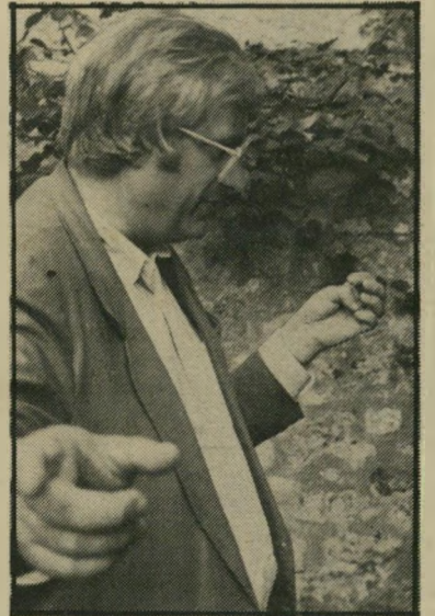
בימאי ברטראן טאוורניה מביקורת לעשייה

ובשלושת ילדיו, ובתו הרווקה. מבחינה חזותית, הצילום אינו מוכיר דווקא את האימפרסיוניסטים, ולא רק משום שהוא חד וחריף, אינו מנסה למרוח צבעים או צורות בעזרת מסגרות אור למיניהן, אלא להיפך. אולם האימפרסיוניזם ישנו, ועוד איד, בדרך שבה