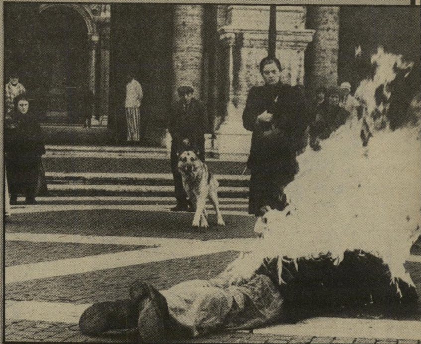
התמונה מתוך סרטו של טארקובסקי: נוסטאלגיה רוסית בניכר

בחיים כמו בסרט. רמזים אלה חוזרים שוב ושוב גם בסרטיו האחרים, שניים מהם עוסקים במדע בדיוני (סולאריס וסטוקר), אחד מכיל זיכרונות, כנראה אישיים, מימי המילחמה, והאחרון, כאמור, הוא התמודדות של אישירוח סובייטי עם הצד הקודר של אוצרות-התרבות באיטליה ועם המרחק המפריד בינו לבין ביתו. עתה יוכל להתנסות בחיים במה שתואר בהצלחה כה גרולה על הכד.