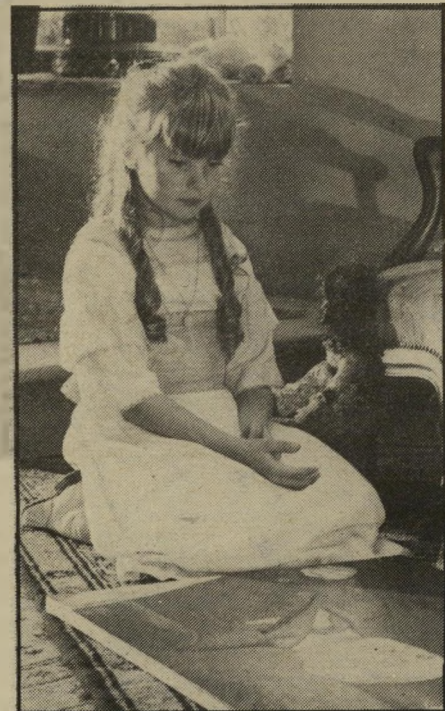
הילדה רמויית המלאך בסרטו של טאוורניה כמו בצעירותם

חרדת הקיץ. מזה עשר שנים הוא עושה סרטים, סרטים אינטליגנטיים ומלוטשים, הוזכים בניקודות טובות מאוד, בדרך-כלל בצרפת. אף אחד מסרטיו לא הוצג בישראל, כנראה משום שמפיצי הסרטים בארץ אינם סומכים על האינטליגנציה של הצופים. יום ראשון בכפר יהיה יוצא-דופן מבחינה זו, משום שמוס'יאון תל-אביב הסכים להציגו.