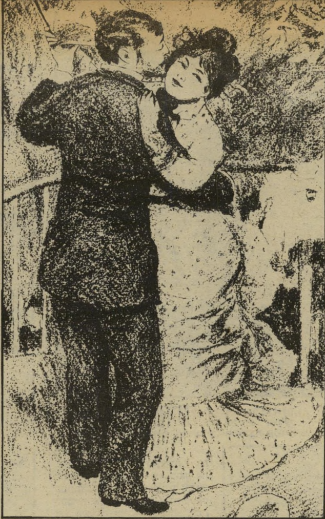
רישום של אוגוסט רנואר