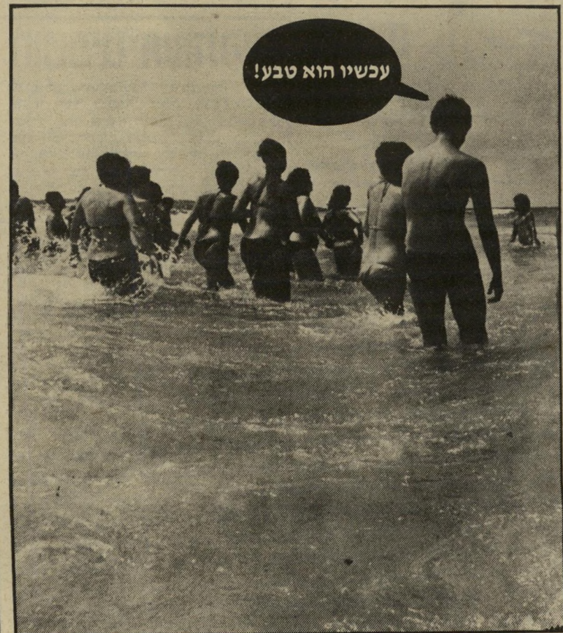
מתרחצים על שפת הים