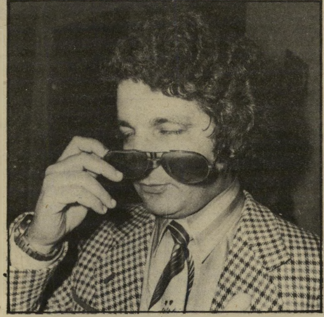
דויד ליבאי שר-המישטרה הבא?