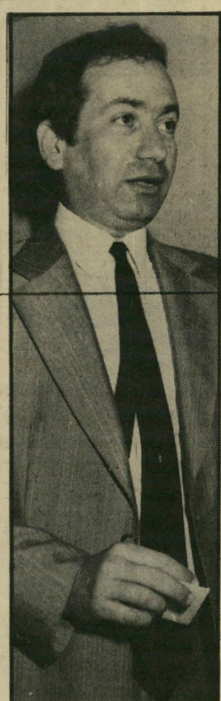
פרקליט בני-שחר לסיניגור הבריטי

מושחת שגנב מיליארד לירות שטרלינג, כשכיהן כשר בממשלת ניגריה וגרם לפשיטת-רגל של ארצו. הם הדגישו בפני חוקריהם את העובדה שלא היו מוזיינים בנשק כלשהו, חם או קר, ושלא השתמשו כמעט בכוח לצורך החטיפה. הם הסבו את תשומת-הלב לכך שהיה בידיהם ציוד רפואי ששמר על חייו של דיקו. הפרשה המזדהה עשתה גלים בעולם. עיתונים מכוכדים כמו הניו-יורק טיימס רמזו עבה לכך