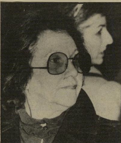
אשת ראש-הממשלה שמיר הבוסית סירבה

כמזכירתה של שולמית שמיר, רעיית ראש-הממשלה יצחק שמיר, עד לבחירות.