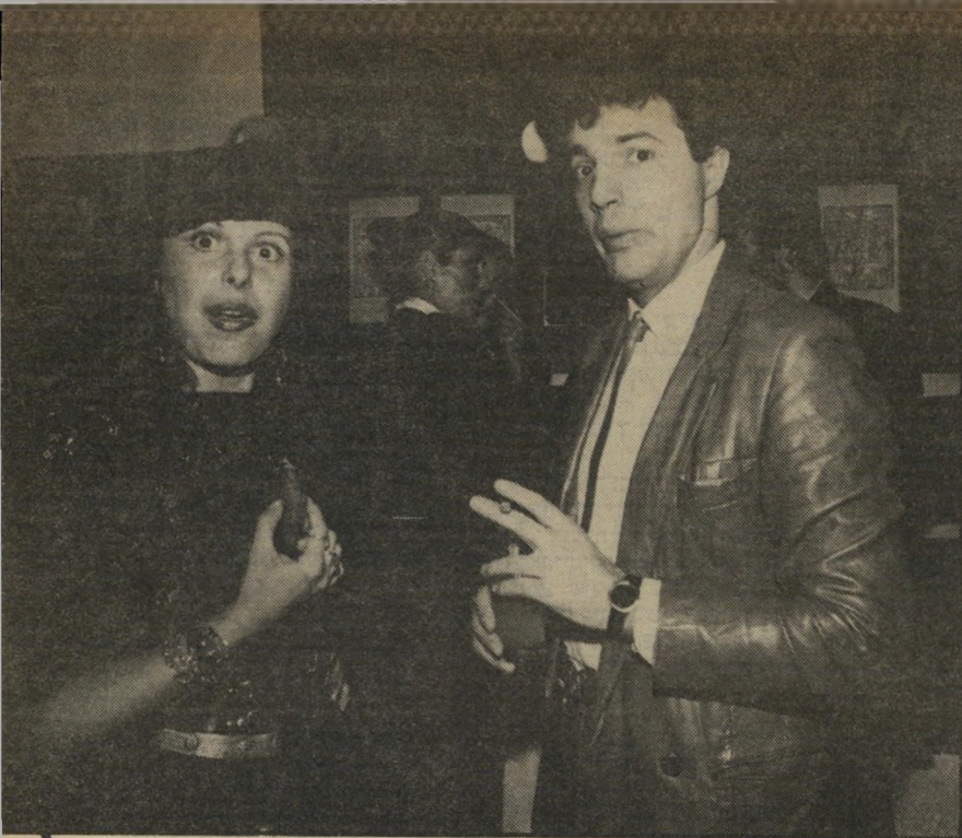
גיארד ונילי טופז יבוא אישי

העסקים לא מונעים מהאחים להיות חברים מכובדים בקהילה היהודית בפרנקפורט. שם אין בודקים בצניעות (וציצים), ותרומות ביד רחבה עוזרות תמיד, גם למטרות ישראליות. מיכל רצתה לחזור ולהשתלב בארץ, ולגדל כאן את ילדיה. נראה שהיא החלוץ לפני המחנה, ושבעיקבותיה יגיעו שאר בני־המשפחה. לאוהבי־מועדונים לא יחסר כאן דבר.