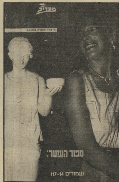
מיבל בקר עסקים בפרנקפורט

ההורים — הוריה של ריבה, וריבה ואחיה התאומים הם חבורת הפורעים שהתעללו בבית. זוכרים שהיתה בלונדה מהממת בצילומי הטלוויזיה? לא עורר! היום היא שטנית מהממת, ובמקום בית ההורים היא זוממת לעשות דברים לביתו של מוטי.