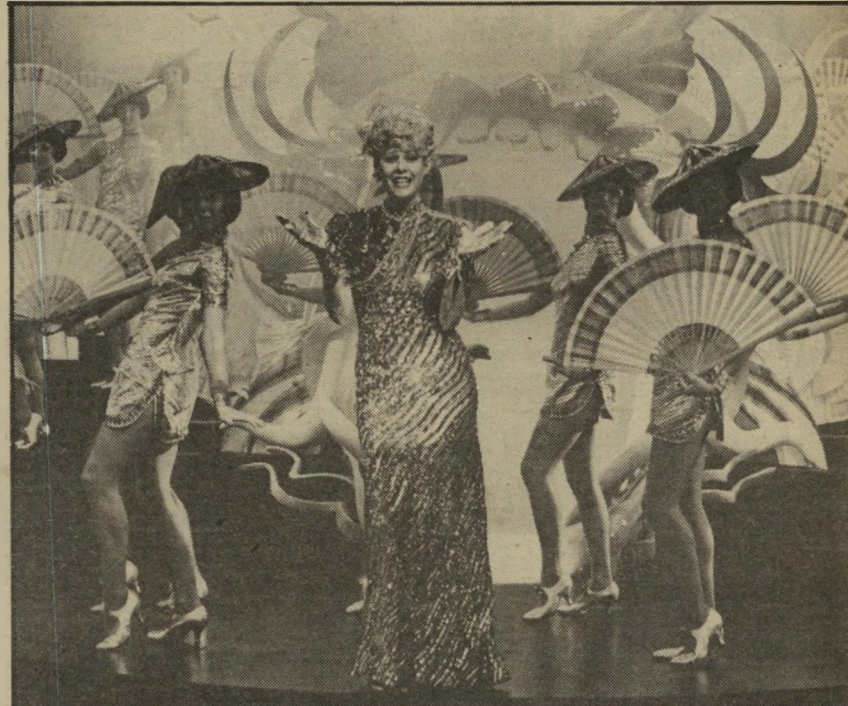
קפשאו במעמד הפתיחה של "אינדיאנה ג'ונס והמיקדש הארוך" יבבנית שתומה

מלידה, אך את שערה צבעה למען צרכיו של ספילברג. היא בעלת תואר מאסטר בחינוך מיוחד וניסיון בטיפול בילדים מפגרים. ולמרות זאת, לעולם איני צועקת. אפילו איני יודעת איך לצעוק." היא מעירה על עצמה. כשניסתה להוציא משהו כגון צעקה מפיה, צחק לה ספילברג: "אני רוצה לשמוע צעקה הגונה, ולא משהו חיוור כזה. פה עושים סרט של אקשן, בובה!"