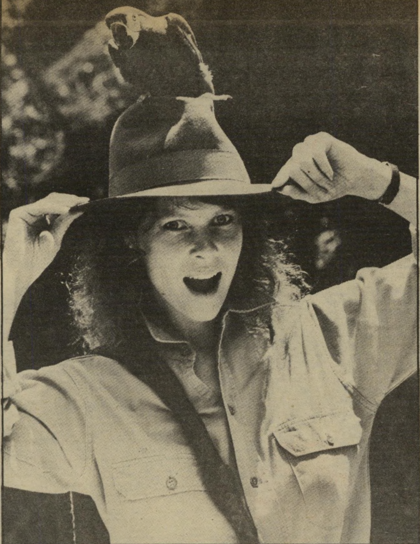
שחקנית קייט קפשאו להתחיל בגיל 30

היו מבקרים שכמעט טרפו אותה, שכתבו על מישהקה: "הבל שהיא לא נפלה כאמת לתופת הווערת." אחרים כינו אותה, "יבבנית שתומה." אבל עובדה היא עובדה: מאז נראתה לראשונה באינדיאנה ג'ונס לא ירדה מעל דפי-העיתונות, מסכי הטלוויזיה, והשערים הציבעוניים של כל המאגזינים למיניהם. כי קפשאו, הצורחת בקול כבייני, או אלוהים! או אלוהים! ומעמידה פני בלונדית מטומטמת, לפי מיטב המסורת ההוליוודית, איננה כזו. למעשה, גם היא אינה מאהבת כרמות שיצר לפי מידותיה בימאי הסרט סטיבן ספילברג: וילי סקוט, זמרת הקבארט, היא גברת מטורפת. לעולם לא הייתי בוחרת לי אחת שכמותה כחברה. הייתי צריכה להתאמץ ולמצוא דרכים כדי לחבב