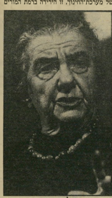
גולדה מאיר להחזיר את ארץ-ישראל העובדת

בוגרי מערכת החינוך הישראלית בעשור השנים האחרון, כימי שרי החינוך אהרון ידלון וזבולון המר, הם המוצר הדליל ביותר, שמערכת זו הוציאה מתוכה, מאז ראשית הישוב היהודי בארץ, כסוף המאה שעברה.