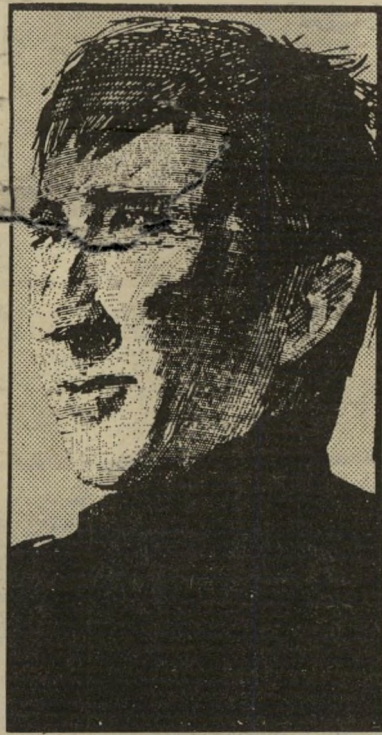
סופר אפדייק שפתן בטעם תעשייתי