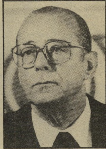
נשיאי ברזיל (פיגואירידו, ממוזשקף) מבסקיקו (דה-לה-מרדיר) וארגנטינה (אלפונסין, משוסם) יש קארטל של חייבים, אין קארטל של נושים!

תובעים מהן לנקוט בצעדים מוניטאריים, המנציחים את העוני והפער החברתי.