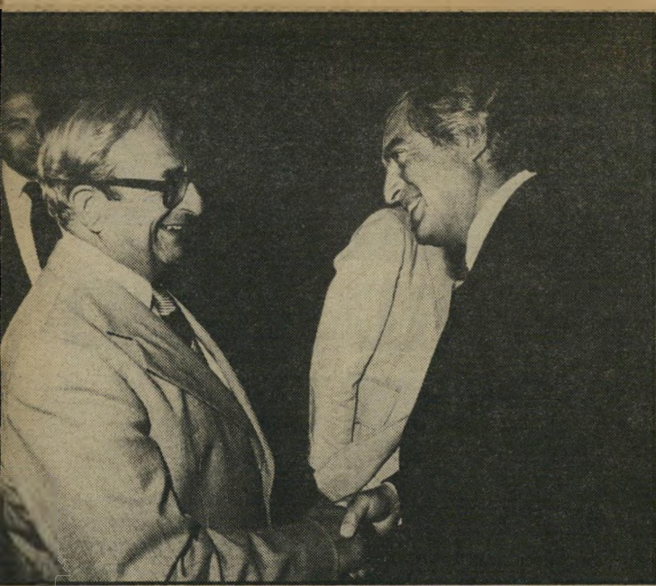
מלאטו עם הנשיא (דאז) נבון בלבנון צחקו

הפשיד הקרה ואמרתי לו: ארונ, שסוריה תיתן שלושה שמות של שבר יים הכלואים כאליאנצאר, שגיבריל יתן — שלושה, וערפאת — שלושה, ותוך שעתיים מרגע שאני מוסר את השמות — הם נוחתים בכיירות להוכחת הכוונות הרציניות שלנו. חזרנו לישראל לדווח על קשר כזה חשוב, סוגר פלאטו עניין. למי הוא