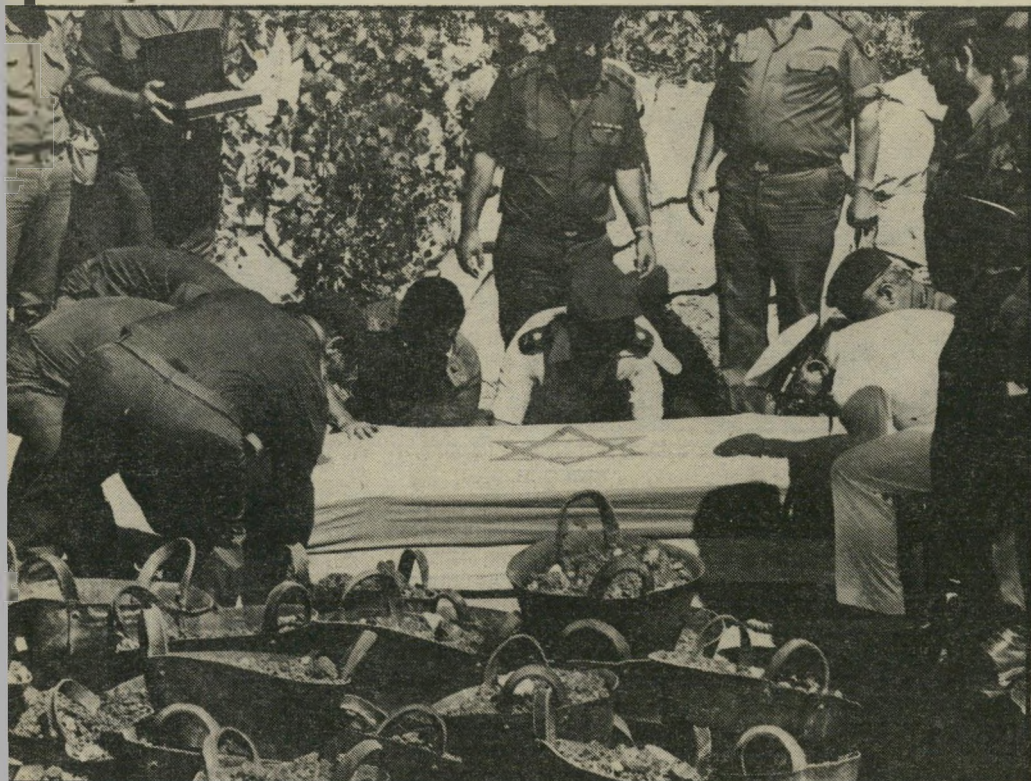
ההלוויה כולה אורגנה על-ידי הצבא. מכיוון שצה"ל הקפיד על השבת, החלו ההכנות רק ביום הראשון בבוקר, ולכן נדחתה ההלוויה לאחר-הצהריים.

אחרי הבחירות הוסיף חטא על פשע. ערב הבחירות נאלץ ידן, באירצון רב, להכניס למיפלתו החדשה את הסוס הטרויאני המנוסה,