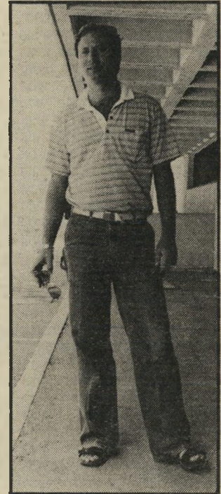
עיתונאי שדה מופתע

לחברת העובדים. אבל זו לא היתה עוגמת-הנפש היחידה של הקבלן. מאז נחשפו בעיתונות פרטים מדהימים על פרשת ההתמוטטות של גג תחנת-הרכבת בחיפה, שבנה דרוקר, שבנס לא נפגע בה איש, וגורמים שונים החלו מקבלים מידע רב, גם פנימי, על הנעשה בחברת דרוקר. כך התברר, שנוסף להתמוטטות בתחנת-הרכבת, התמוטט גם טעם בחומר זול ומטיב ירוד, בניגוד למה