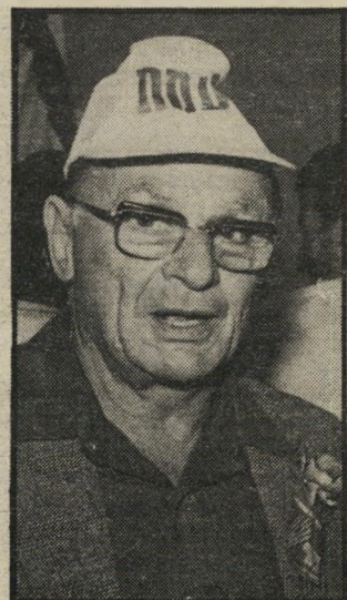
ראשי-עיר גוראל מודאג

שנקבע בתוכניתו. פרשה אחרת שבה נקשר שוב שמו של דרוקר היא כבניה חריגה חמורה מגישורן-בטון שכנתה חברת דרוקר בתחנת-הרכבת בחדרה. סיבת ההתמוטטות, כפי שהעלתה חקירה עיתונאית, היתה שהבונים השתמשו בפרוייקט סטלה מאריס בחיפה.