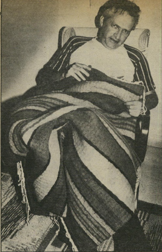
אורג השטיחים דני מציג את השטיח. אחד משניים, שארג במיסגרת הריפוי־בעיסוק. חברו לאריגת־שטיחים היה השר לשעבר ישראל גלילי, שנפגע גם הוא מאירוע מוחי.

לי שאין טעם שיכתבו על המצבה שלי „נפטר מפני שאיוה ומר זיף.“ הציעו לי כבר עבודות, אבל ברור שלא אוכל לעשות אותן. גם אם ארצה. הבטיחו לתת לי עוזרים ועוזרי־עוזרים, רק שאהיה בתמונה, כמנהל אמנותי. רחיתי את כל ההצעות. אני חושב שהקארייריום היה אחת הסיבות למה שקרה לי. עכשיו יש גבול למחיר שאני מוכן לשלם בשביל הצלחה. היום אני בטוח שביקורת רעה בעיתון לא תרגיז אותי כמו פעם. תצחק אותי, אולי. אני לא חושב שסנדרלר רוצה ללכת ולהתאבד אם אני גוער בו איזה מין סנרלים הוא תפר לי. אז למה שאני אקח ללב? אני רוצה להמשיך ללמוד היסטוריה. התחלתי לפני שחליתי, באוניברסיטה הפתוחה. אלמד לאט־לאט. לא מרגיש שמשוהו בווער לי, כמו שחשבת קודם. אז אקבל תואר בעוד עשר שנים, אם אחיה. ואם לא, אמות בלי תואר. אני לומד עכשיו בשביל הכף, ולא מכניס את עצמי ללחצים. (המשך בעמוד 62)