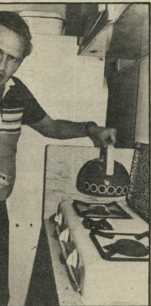
בודד במיטבה בדירתו. מכין קפה. המחלה מהווה לגביו גם מכה כלכלית אנושה.

לי שאין טעם שיכתבו על המצבה שלי „נפטר מפני שאיוה ומר זיף.“ הציעו לי כבר עבודות, אבל ברור שלא אוכל לעשות אותן. גם אם ארצה. הבטיחו לתת לי עוזרים ועוזרי־עוזרים, רק שאהיה בתמונה, כמנהל אמנותי. רחיתי את כל ההצעות. אני חושב שהקארייריום היה אחת הסיבות למה שקרה לי. עכשיו יש גבול למחיר שאני מוכן לשלם בשביל הצלחה. היום אני בטוח שביקורת רעה בעיתון לא תרגיז אותי כמו פעם. תצחק אותי, אולי. אני לא חושב שסנדרלר רוצה ללכת ולהתאבד אם אני גוער בו איזה מין סנרלים הוא תפר לי. אז למה שאני אקח ללב? אני רוצה להמשיך ללמוד היסטוריה. התחלתי לפני שחליתי, באוניברסיטה הפתוחה. אלמד לאט־לאט. לא מרגיש שמשוהו בווער לי, כמו שחשבת קודם. אז אקבל תואר בעוד עשר שנים, אם אחיה. ואם לא, אמות בלי תואר. אני לומד עכשיו בשביל הכף, ולא מכניס את עצמי ללחצים. (המשך בעמוד 62)