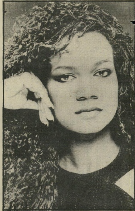
קסנה בולטת לטובה

מה הטעם במוצר טוב, אם איש לא שמע עליו? השאלה הזו היא הבסיס לכל מיישד-פירסום, וגם לכל מפיץ, אמרגן או יצרן כלי-נגינה במוסיקה. מדובר גם בג'ון קייג'י, גם בג'ון קייל, גם בקרל מריה ג'וליוני וגם כמו, פנדר וקורג. השאלה הזו היא יסוד גם בקאריירות של ברנשטיין וקאריאן,