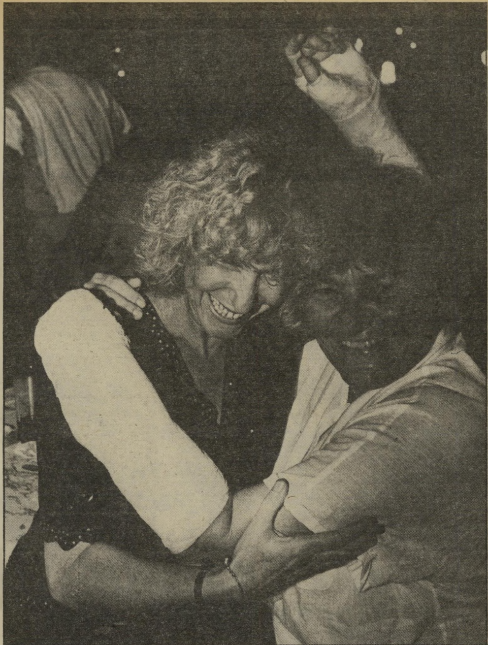
נמגעה כשעשתה תנועה לא נכונה בהצגת טנזי. השתיים שמחו למיפגש. את המזון למסיבה סיפקה המיסעדה הצמודה לתיאטרון, שבה מועסק טבח ממינכן, הנחשב לטבח המעולה ביותר שנמצא בארץ.