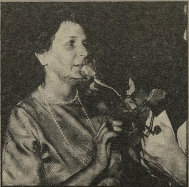
אורה הרצוג אשת הנשיא דוחה את הציפורן שמגישה לה אחת המתנדבות של עם יפה. כשציפורן תחובה בפיה היא מושיטה יד לדחיה. הרצוג היא היושבת-ראש של האגודה, שהתכנסה השבוע בקולנוע לב 1. בתל-אביב. לחזות בסרט לה-טרוויאטה.