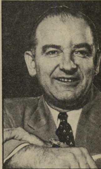
סנטור מקיפארתו רדיפה אחרי 15 שנה

צ'ארלס לוטון היה שחקן בלתי-רגיל, בעל רגישות נדירה, סהרורי, סומך על אינטואיציה אבל מאוד אינטליגנטי, מרגש ביותר כשהוא מאופס היטב בתפקיד, אבל חסר מישמעת, ולעתים מתקשה להחזיק