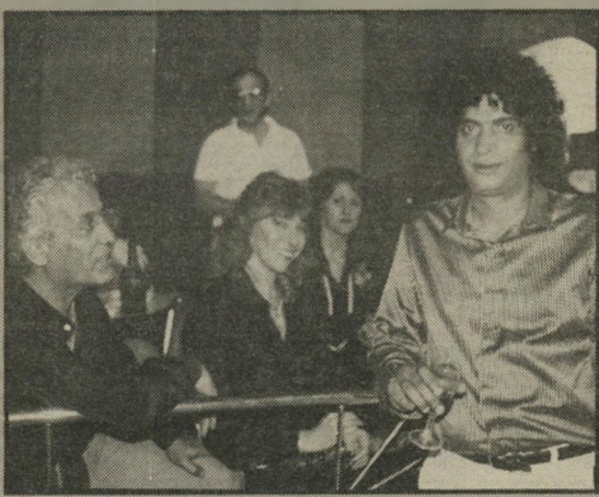
חופני: הקסטה של המדינה

במיסגרת כזאת ברור ששימחת העניים כשימחה אמיתית, וכל סממן של תרבות הוא אחיות-עיניים, הפיזיונומים, הנדחסים בזה אחר זה, בביצועים שונים, ללא כל קשר לעלילה, מצולמים בצורה השגרתית והמשעממת ביותר, בלי טיפת דמיון, ואיש לא חשב שכאשר מצלמים רקדנית-בטן, כדאי פעם להראות גם את הגוף כולו בפעולה, ולא לבודד בכל פעם אבר אחר, כאילו מדובר בנכה שיש בה משהו פגום.