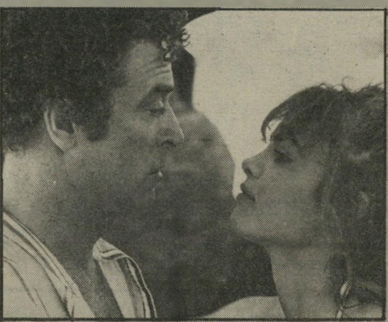
מישל גונסון ומייקל קיין: אבא או סבא?

כדי להוסיף להמצאה הבנאלית הזאת, שהשראתה נשאבה מתוך סרט צרפתי של קלוד ברי, קצת פאפריקה, מתהלכת המתבגרת עירומה ככל האפשר, ראשית, התחבולה שביסוד העלילה, היתה אולי נסבלת לפרק קומי קצר בטלוויזיה, אבל לא יותר, שנית, מייקל קיין,