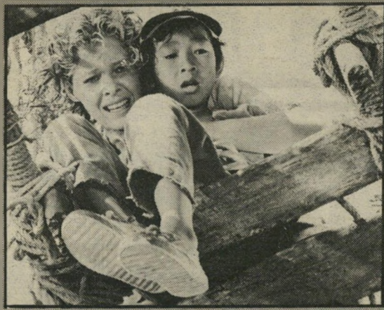
קייט קאפשו וקיי הוי קוואן: רועדים בצמרת

אם בסרט הקודם התרכזו מעללי הפרופסור במרימדות של מצריים שצולמו בטונים, הפעם זה מתרחש במיקדשי הודו והארמונות המסתוריים של נסיכה שם, שצולמו דווקא בסרי-לאנקה. שוב, החלק המיסטי הוא כבד מאוד, לשם שינוי לא מדובר כאן בארון הברית, אלא רק בחמש אבנים אנדיות אשר יחדיו, עשויות לתת כוח ללא מיצרים בידי כת רצחנית ומסוכנת.