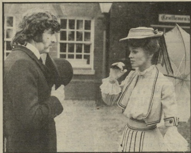
ג'ולי בריסטי ואלן בייטס ב"המקשר" האריסטוקרטית והאיכר

סרטים מאותה התקופה כמו פגישה מקרית או הרוצח, מעידים כבר על סיגנון קולנועי מלוטש, על שימוש אלגנטי ביותר בתנועות המצלמה, על גישה חזותית מעוצבת היטב, משולבת באיבחון דק של יחסים בין בני