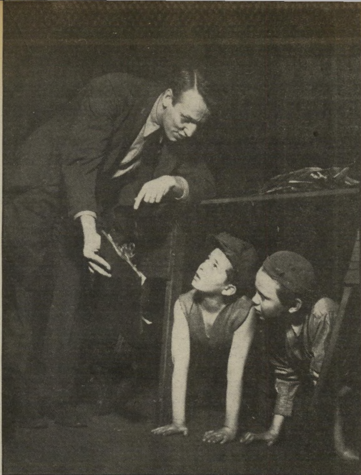
ג'וזף לוס' מביים את סידני לומט וג'יימס לידן ב-1938 התחלות בתיאטרון

מי שעקב אחר סרטיו של ז'וזף לוס 30 השנים האחרונות, ולא טרח בדוק את קורות חייו, עשוי להשוב, מיה רבה של צדק, כי מדובר באחד נימאים הבולטים של אנגליה אחרי ילחמת-העולם השנייה. אולם לוסי, הלך לעולמו לפני שבוע, בגיל 75, י' יליד איצות-הברית, אמריקאי והתו ובאפיו, איש אשר בילה את מחצית השנייה של חייו באירופה, לא תוך בחירה, אלא מכורח המציאות. הוא עזב את מולדתו, כפי שעשו יד כמה אמנים ידועים בתחילת שנות ה-50, בשל רדיפות הסנטור הקומוניסטי, שבעיניו נחשד לוסי