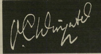
חתימת ידו של וינגייט

הגיעו הדברים לידי כך, שמתרגם סיפור החשוב של כריסטופר סייקס אורד וינגייט (או העורך של התרגום), "תיקן" את שמו של וינגייט.