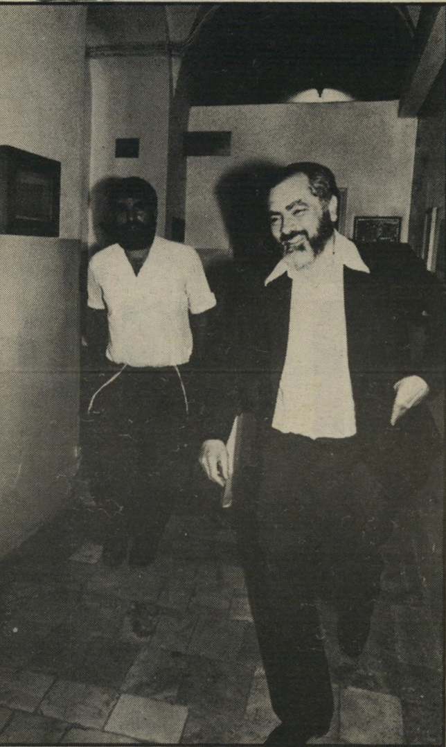
לרוץ לכנסת הרב מאיר כהנא יצא מאולם בית-המישפט, מייד אחרי שניתנה ההחלטה שאיפשרה לו לרוץ לכנסת. כשהוא זורח ועל פניו המזוקנים חיוך מאוזן לאוזן.

לתומו: למה הגיעו כלי-כך מעט פעילים? ואחד מן הפעילים הספורים, חבוש כיפה וציציות מתנופפות מתוך מיכנסיו הכהים, ענה: נו, מה אתה רוצה? כל השאר בבית-הסוהר! אולם בית-המישפט עצמו, בקומה השנייה של הבניין, כריזק מעל לראשם של הנזירים הרוסיים, המה מפה לפה. על דוכן-השופטים, מתחת לתיק רתעץ חומה-כהה וסמל המדינה היו חמישה כיסאות. שלושה כיסאות גרר לים, כעלי מישענת גבוהה ומרשימה, ועוד שני כיסאות-עץ קטנים, פשוטים, וכנראה לא נוחים במיוחד. במרכז, על כיסא גדול ונות, ישב (המשך בעמוד 17)