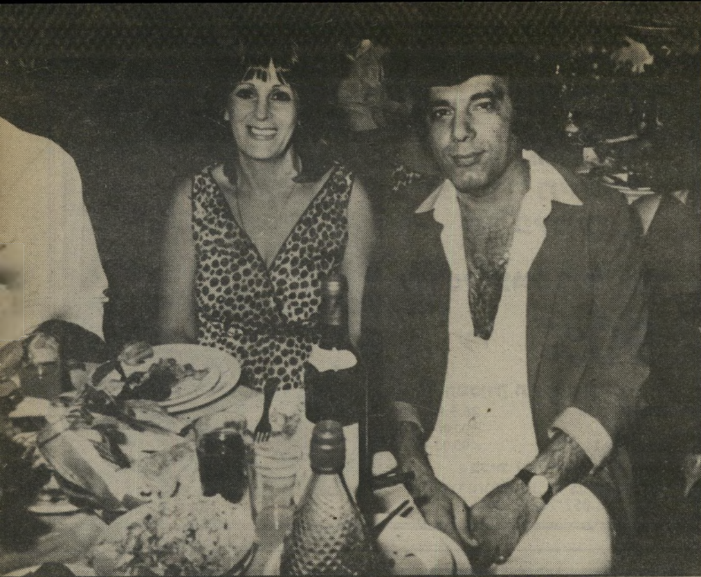
קרבן מורד ואשתו יפה שיחות בעניינים אישיים

אני לא יודע באיזה שלב של המיקרה ברחו אמי ואחותי לשכנים.