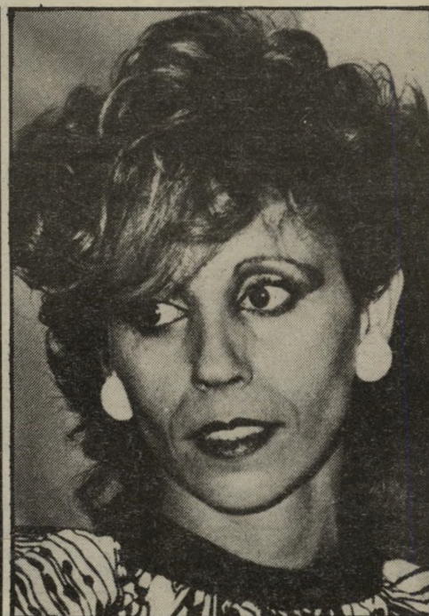
חברה יפה התיידד עם הילדים