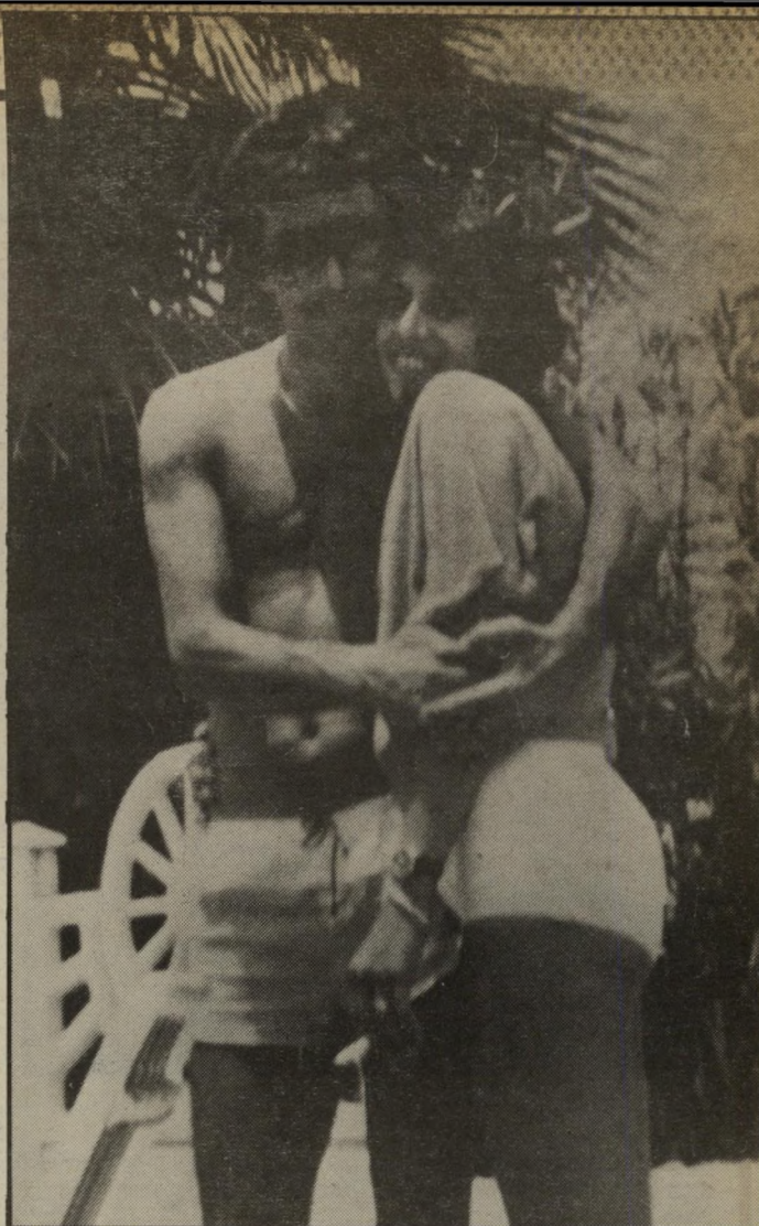
רוצח המתאבד תורגמן (עם קרובת-מישפחה) עבודה, קריאה וציור